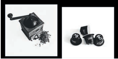
MANGEZ MAINTENANT !