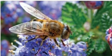
PARTAGEONS LA BOUFFE PHOTO-CLUB DU PL BERGOT 20