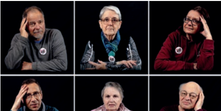
TRENTE PHOTOS PLURIELLES PHOTOPLURIEL ORLÉANS 10