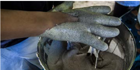
LA MAIN À LA PÂTE ATELIER PHOTO EMS DON BOSCO 25