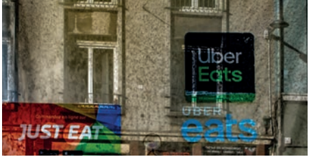
JUST EAT, ON FERME ! ATELIER PHOTO DE SAINT PIERRE 23