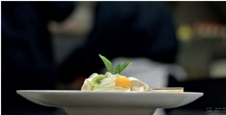
DE LA TERRE À L'ASSIETTE PHOTO-CLUB LANDIVISIAU 10