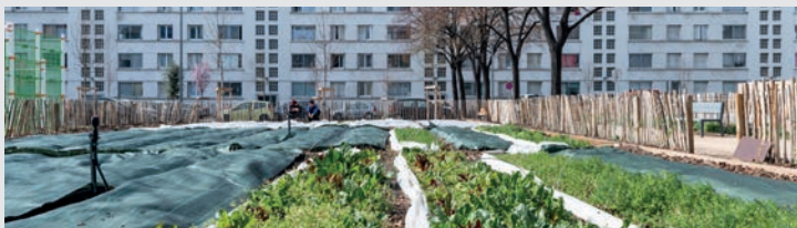
BÉATRICE PRÈVE Issue de l'école supérieure des Beaux-Arts de Lyon, Béatrice Prève raconte des histoires humaines, témoigne de situations ou de parcours particuliers : elle est photo journaliste, membre du Collectif DR dont l'ADN est le reportage pour la presse.