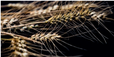
EN SAINE FOCALE IROISE ELORN 18