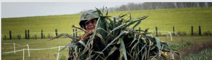
RAPHAËLLE TRECCO Photographe professionnelle depuis 2015, Raphaëlle Trecco s'est consacrée à la photographie de famille et a développé de nombreux projets photos dans des écoles. Depuis 2020 elle se concentre sur le reportage en documentant l'insertion des publics fragilisés dans la société.