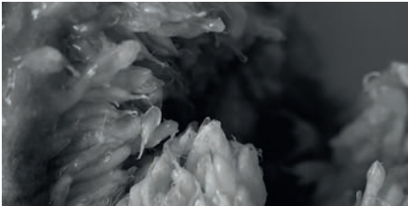
TERRES D'ALIMENTS GAAEL 11