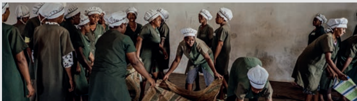
ALEXANDRA DIVES Alexandra de Dives est une photographe indépendante représentée par le Collectif DR qu'elle a intégré début 2020. Forte d'une expérience de près de 30 ans dans la photographie, Alexandra de Dives met en avant les combats d'individus face à une société parfois figée.