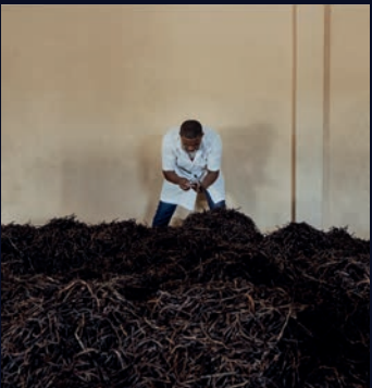
ALEXANDRA DIVES 5 6 13 27 L'OR NOIR DE MADAGASCAR