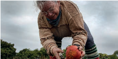
LA TERRE DONNE, LA MÈRE VEILLE FOTO'GASTEL 16