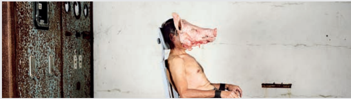
ALEXA BRUNET Née en 1977, Alexa Brunet est une photographe française diplômée de l'Art College de Belfast et de l'ENSP d'Arles. Seule ou en coopération avec des rédacteurs-trices et des artistes, elle travaille principalement pour la presse, les collectivités et des organismes indépendants.