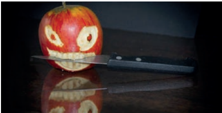
MÉTIERES DE BOUCHE PHOTO CLUB DE SAINT-RENAN 26